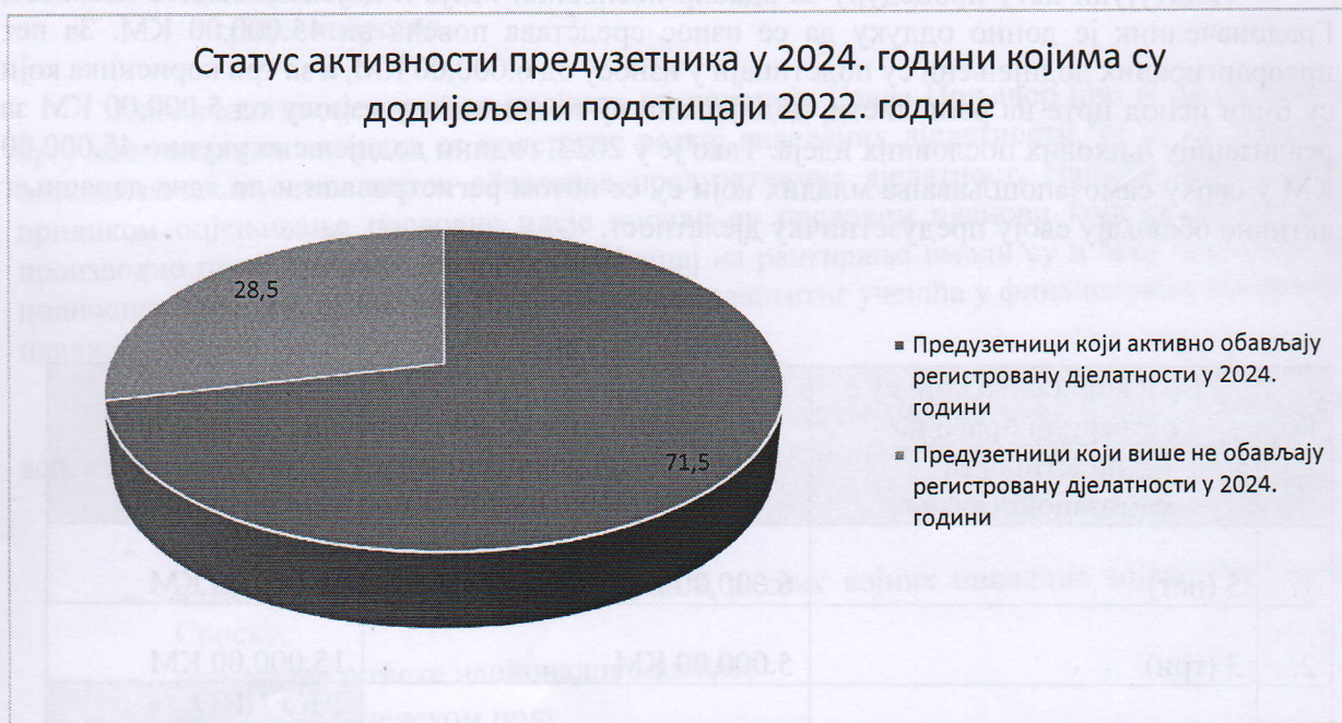
2.1.1. Графички приказ активних и одјављених предузетника којима су додијељени новчани подстицаји 2022. године

Изражено у процентима, 71,5% предузетника (пет од седам корисника) који су регистровали дјелатности послуже додјеле новчаних подстицаја за samozapoшљавање у 2022. години активно обавља регистроване предузетничке дјелатности већ трећу годину.